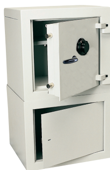
Socle ouvrant SO300 sous coffre C500 à disque