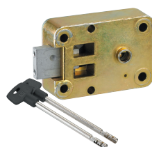
Serrure Lagard 2200