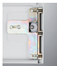
Fermeture par pêne 3 points