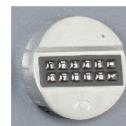
Mod. KE: EM2020+T6530