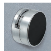
Mod. KC: LG3390+LG1730